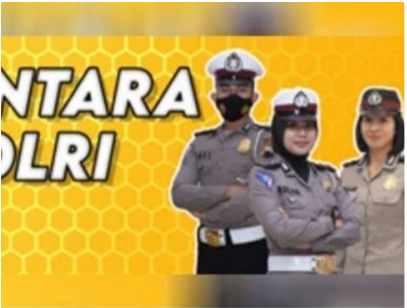
Penerimaan Polri Bakomsus

PALANGKA RAYA - Kesempatan terbuka bagi lulusan bidang pertanian, perikanan, peternakan, gizi, dan kesehatan masyarakat untuk bergabung menjadi anggota Polri melalui program penerimaan Bintara Kompetensi Khusus (Bakomsus).